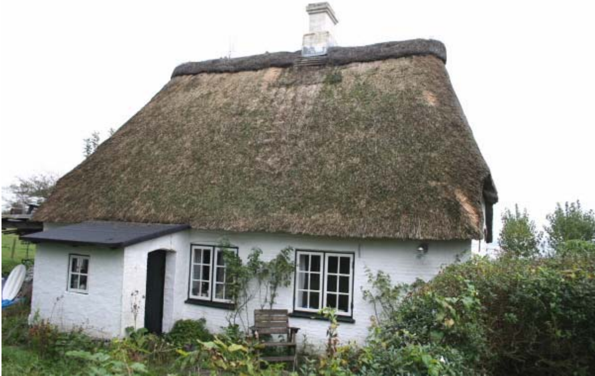
Vestfacade med bislag

Fraset bislaget og den lille værkstedstilbygning fremstår husets ydre som ved opførelsen i 1834.