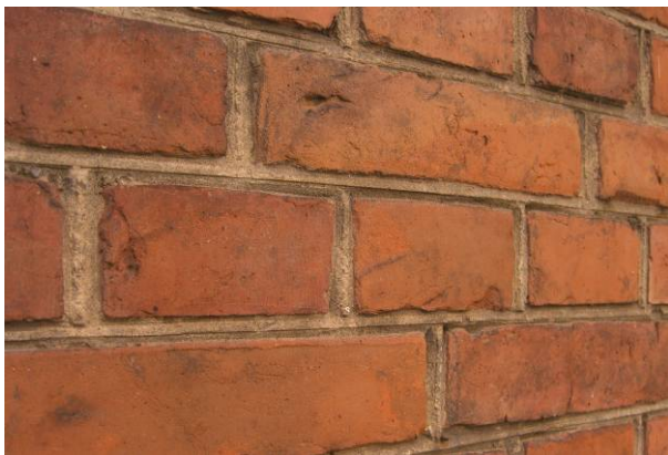
Brændte fuger. (7a)