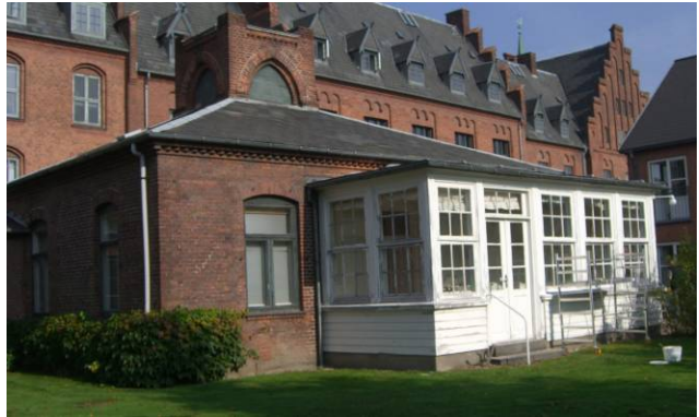
Verandaen mod syd. (7a)