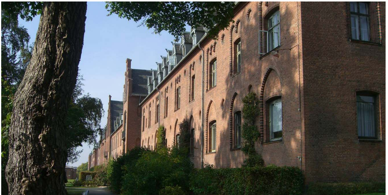
Det elegante kig langs bygningens sydside, bør bevares og friholdes fra evt. nye bygninger.