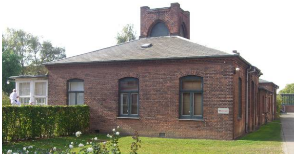
Den velproportionerede bygningskrop. (7a)