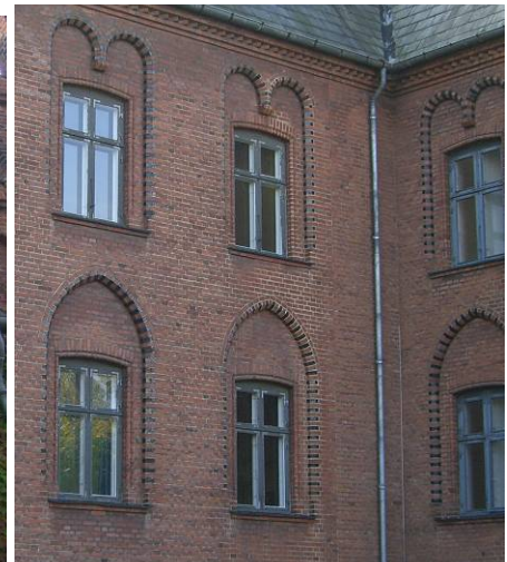
Blank mur med fine vinduesindfatninger.