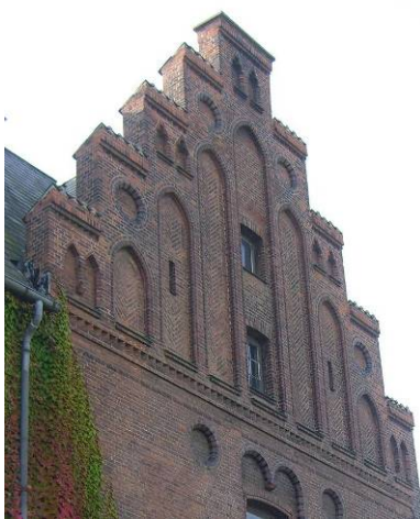
Kamtakker og blændingsdetaljer.

Bygningernes særlige kendetegn som kamtakker, skifertage med små spidse kviste og fine murværksdtaljer om vinduerne samt den samlede ubrudte murflade bør bevares. Ligeledes bør de oprindelige vinduer og døre bevares, på samme måde som bygningernes stærke planløsning ikke bør sløres af yderligere bygningsvolumener i gårdene eller nye udskud.