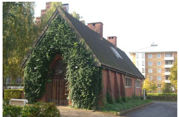
Stæbepiller og monumental dør.

Bygning 8a: Bygningen er opført i røde teglsten og har et bestant udtryk med meget små vinduesåbninger og stæbepiller. Taget er belagt med mørkt tagmateriale. Bygningen bør bevares, hvis der kan findes en fornuftig fremtidig brug.