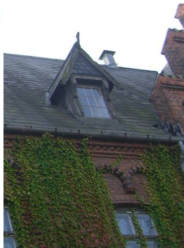
Skifertag og elegant kvist.