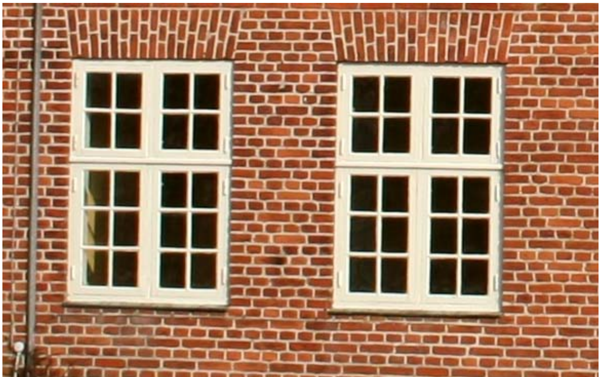
De originale vinduer i stue mod vest.

Vinduerne er hvidmalede, opsprossede kitfalsvinduer. Hovedparten af vinduerne er korspostvinduer med fire ruder i de øverste rammer og seks i de nederste. I kvisten torammede vinduer med otte ruder i hver ramme, og i gavltrekanten et halvcirkulært vindue