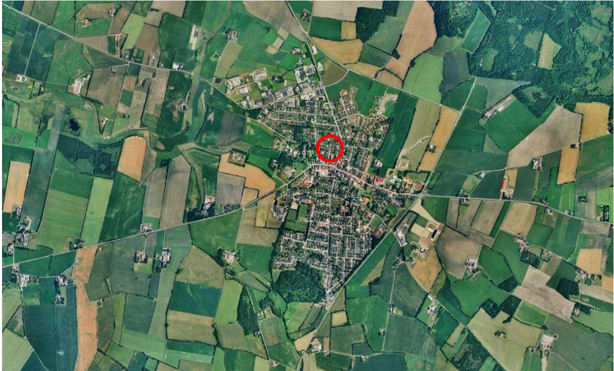
Rødning by se fra luften

Villaen er beliggende i den nordlige del af Rødning i et homogent kvarter præget af bedre byggeskiksvillaer fra omkring 1910-1930.