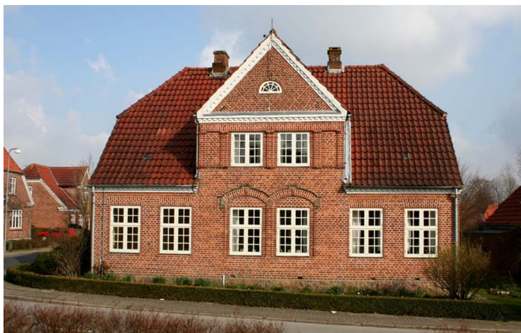
Ark. Aakjærs villa i Rødding, tegnet af ham selv i 1912. Forsiden mod vest. Foto fra foråret 2010.

Villa, sammenbygget med lille fløj, oprindeligt til stald (nu garage), beliggende Møgelmoosevej 3, 6630 Rødding, matr. nr. 300 af Rødding Ejerlav, Rødding, Vejen Kommune.