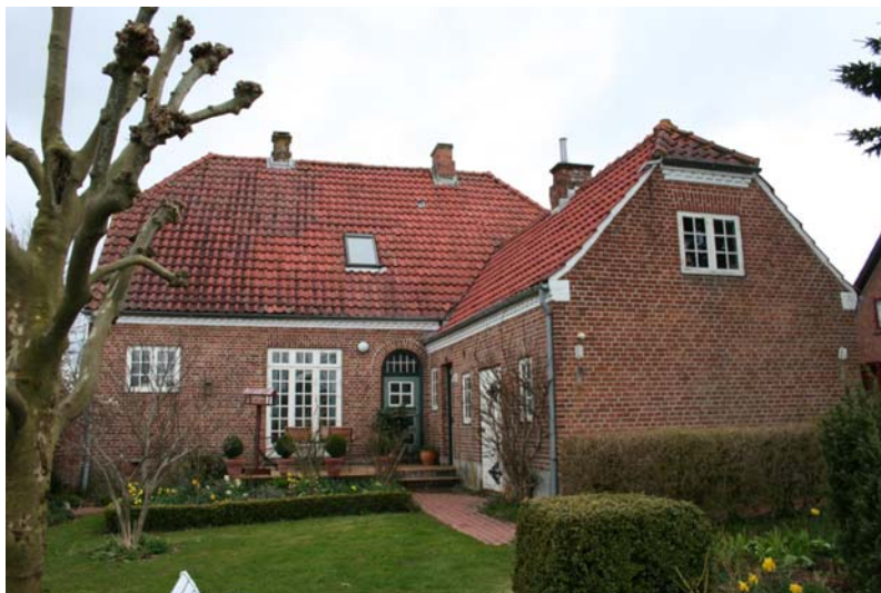
Bagsiden af villaen (set fra øst) med tilstødende udhusfløj.

I sidebygningen i nordgavlens forlængelse mod øst ligger den tidligere ”Pferdestall”, der i dag fungerer som garage. Denne sidebygning er væsentligt smallere og lavere, men i stil og byggematerialer som selve villaen. Dog er valmen væsentligt mindre – ca. kvartvalm. Mod havesiden findes bryggersdøren og døren til den tidligere hestestald. En garageport imod Møgelmoesevej er etableret omkring midten af 1900-tallet.