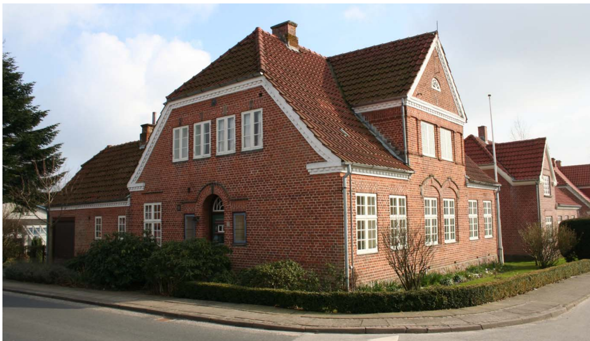
Villaen med sidefløjen, set fra nordvest. Fot. 2010.

Villaen er vinkelbygget og opmuret af røde sten i krydsforbandt på en sokkel af tilhuggede granitsten med fremhævede fuger. Der er to traditionelle skorstenspiber. Taget er halvvalmet og belagt med røde falstagsten.