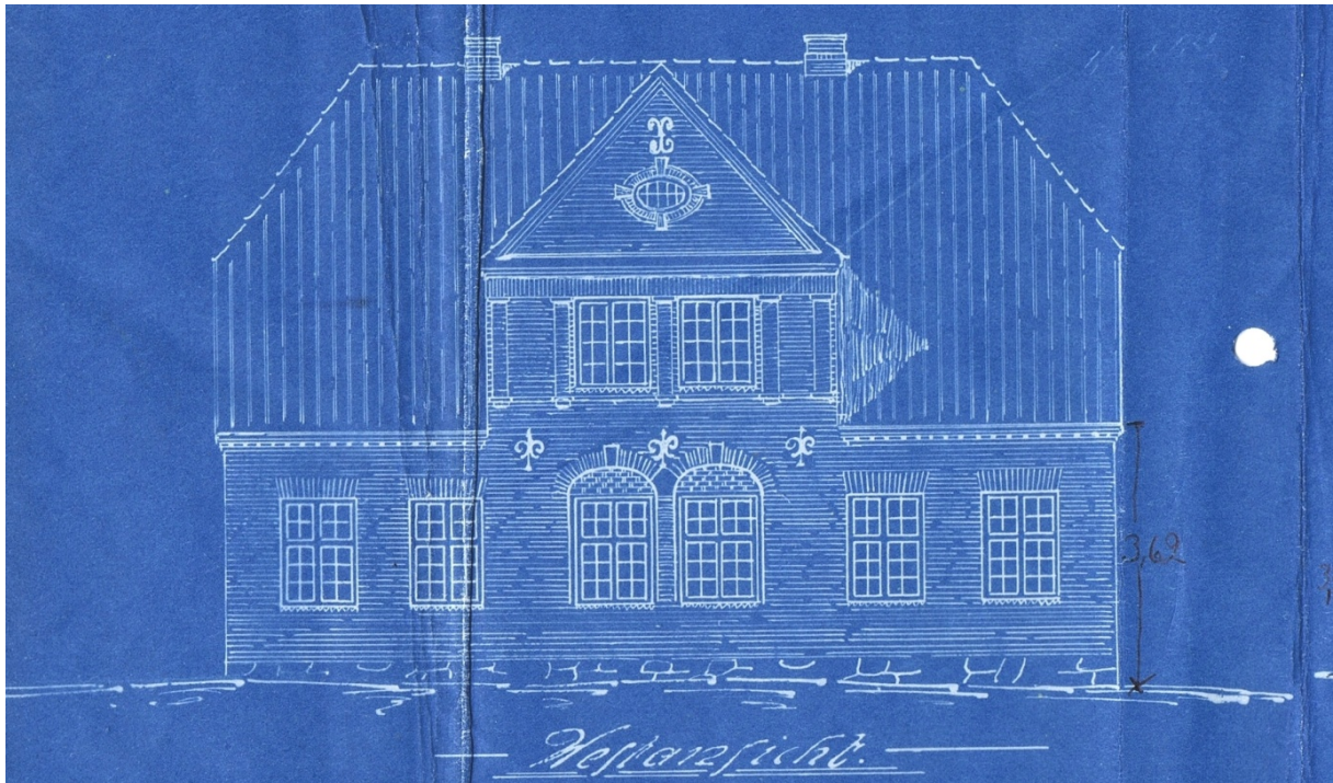
Aakjærs egen tegning af vestfacaden; blandt afvigelserne i det færdige byggeri er vinduet i gavlkvisten og udeladelse overalt af murankre. Tegning i privateje.

Vinduerne er hvidmalede, opsprossede kitfalsvinduer. Hovedparten af vinduerne er korspostvinduer med fire ruder i de øverste rammer og seks i de nederste. I kvisten torammede vinduer med otte ruder i hver ramme, og i gavltrekanten et halvcirkulært vindue