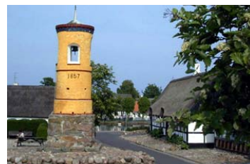
Foto: klokketårnet i Nordby