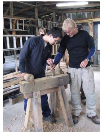
Foto: fra tidligere kursus