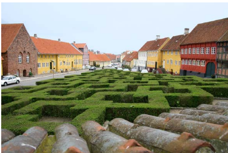
Set fra Vor Frue Kirke, 2004.

Anlægget er på alle sider omgivet af brosten i granit. Adelgades vejbelægninger er anlagt i asfalt og fortovene er anlagt i granitskærver. Mod vest afgrænses parterret af kirkegårdsmuren og kirken. De to husrækker på hver side af den kileformede plads og selve domkirken giver den vertikale afgrænsning af det usædvanlig harmoniske og smukke byrum.