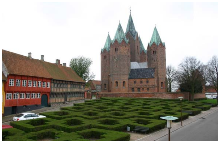
Set fra Bispegården, 2004.