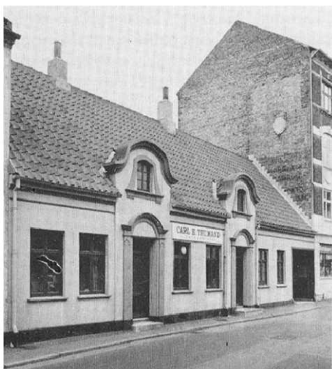
Graven 20. Ældre foto fra Bygningsregistranten for Århus. Husets facade mod gaden viser på flere måder den dag i dag, at der gemmer sig et over 300 år gammelt bindingsværkshus inde bag pudsen. Det høje vægstykke over vinduerne viser den gamle styrtrumskonstruktion, de smalle vinduespiller viser bindingsværksstolpernes placering, de to tagskægskviste er reminiscenser fra det oprindelige stråtag og den høje, markante tagrejsning, er meget typisk for renæssancens og barokkens bygninger.

Derudover står huset helt originalt fra den seneste ombygning i 1905, hvor også overpudsningen fandt sted. De to indgangsdøre mod gaden blev i 1981 skiftet ud med to nye, i og for sig udmærkede kopier af de gamle, men det er dog så heldigt, at den ene af de gamle originale døre blev 'reddet' af snarrådige folk til forvaring i 'Den gamle By'. Herfra kan den komme tilbage i huset igen.