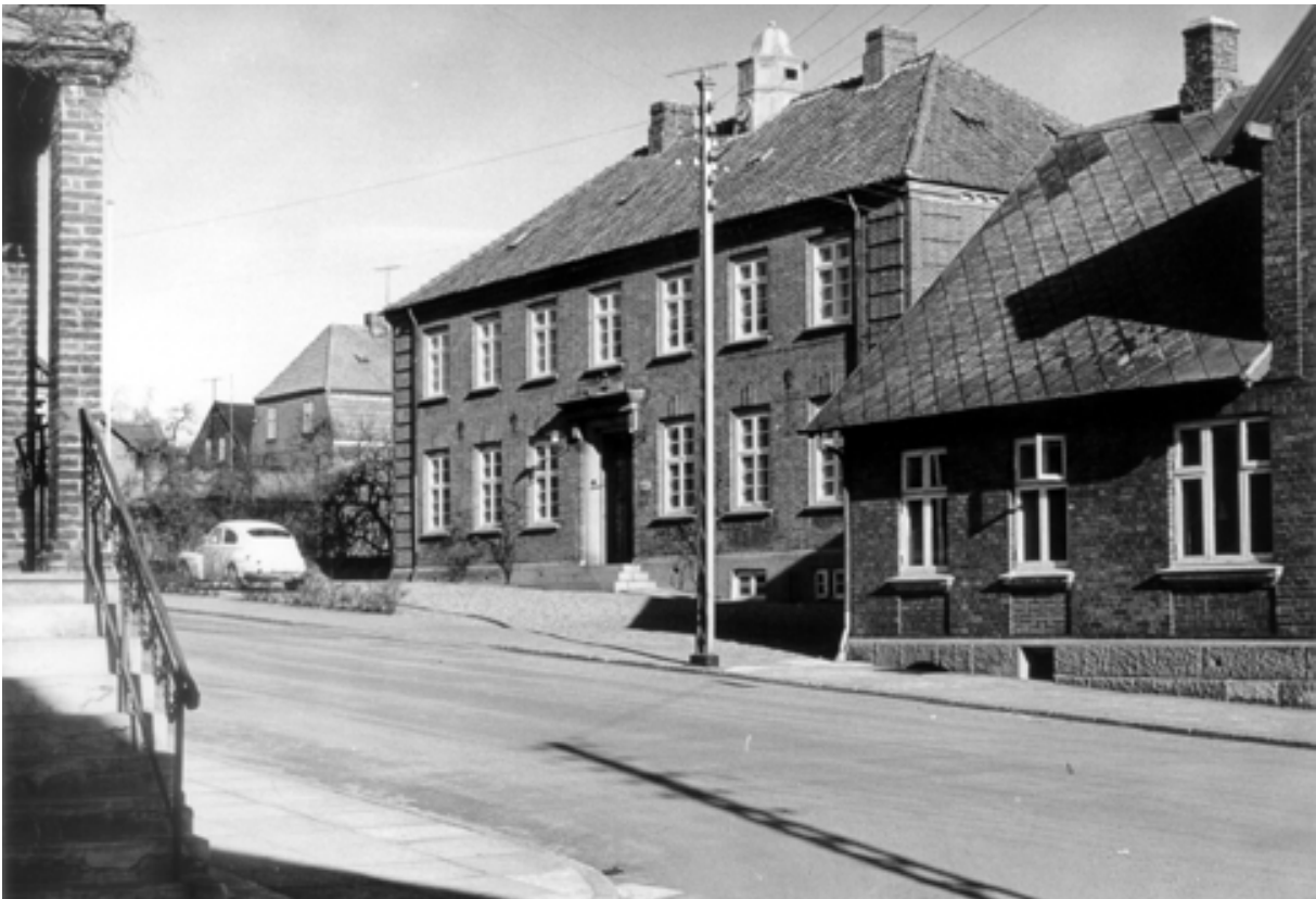
Foto af Hadsund Politistation fra omkring slutningen af 1950'erne.