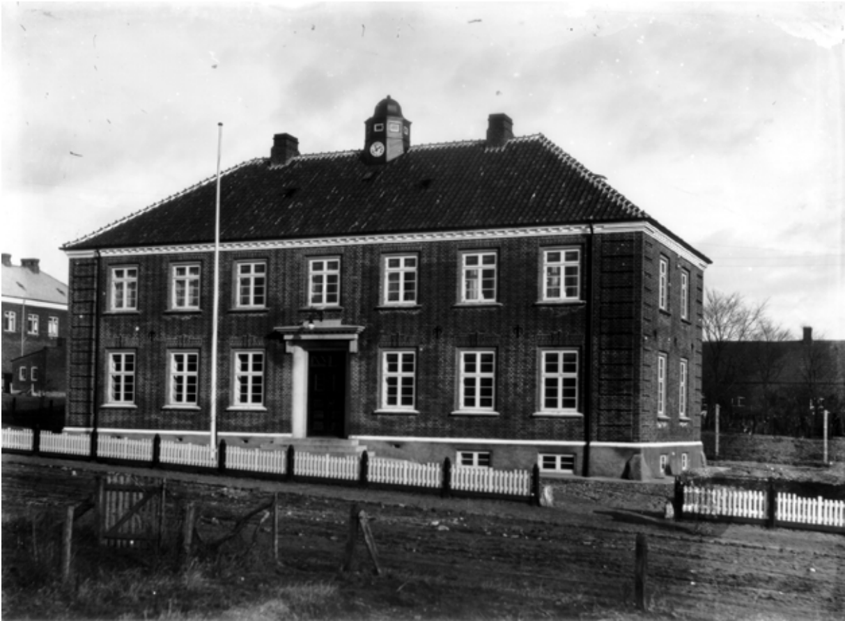
Foto af Hadsund Politistation fra omkring opførelsestidspunktet. Bemærk den hvidmalede gesims og sokkelafslutning.