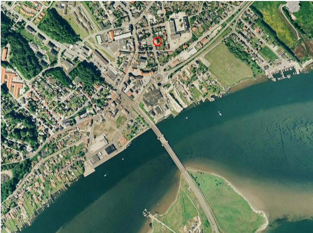
Luffoto over Hadsund by, med angivelse af Hadsund Politistation.