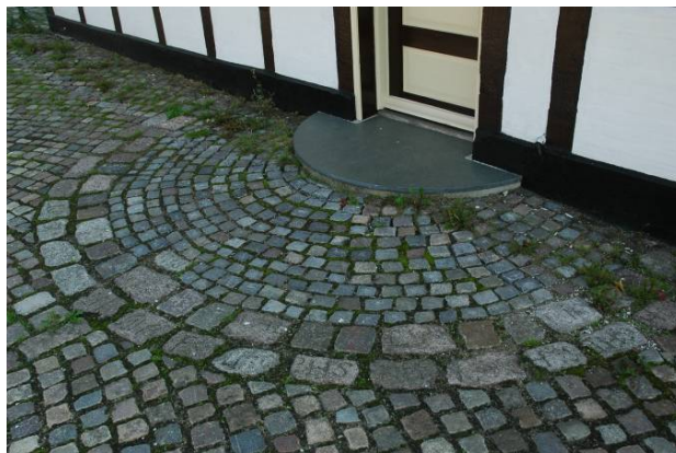
Forpladsen er omlagt i 1999