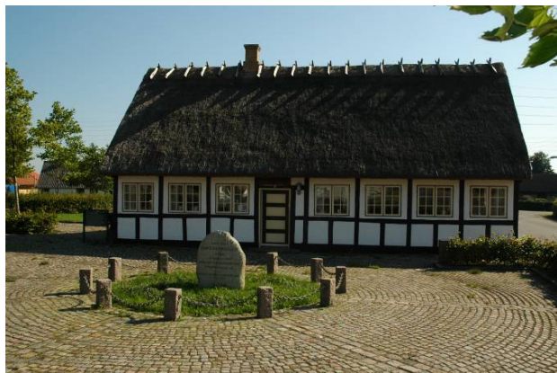
Forpladsen med mindesten