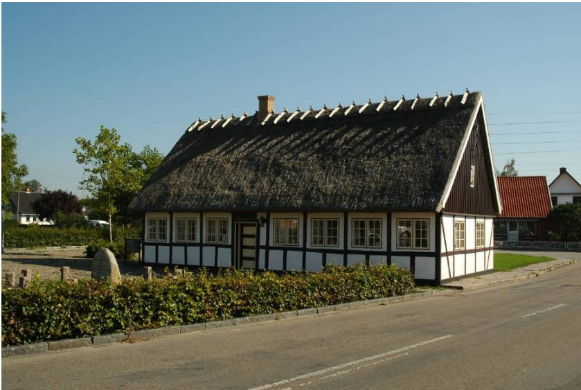
Kommunalhuset i Vålse